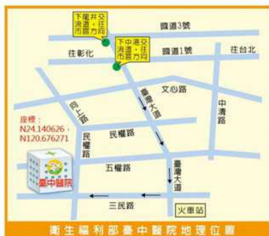
衛生福利部臺中醫院地理位置圖