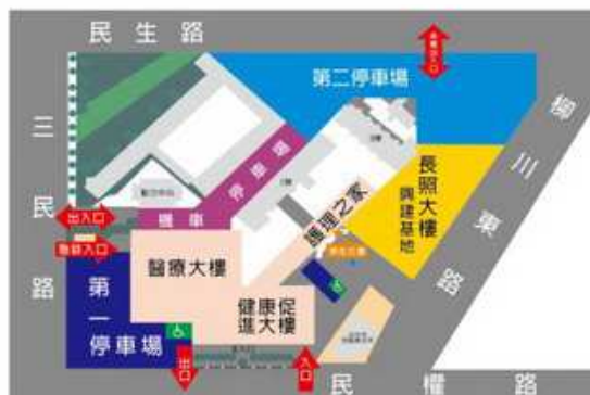
衛生福利部臺中醫院停車場位置圖