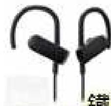
鐵三角 藍牙無線運動耳機