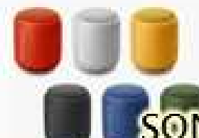
SONY 可攜式無線防水藍牙喇叭